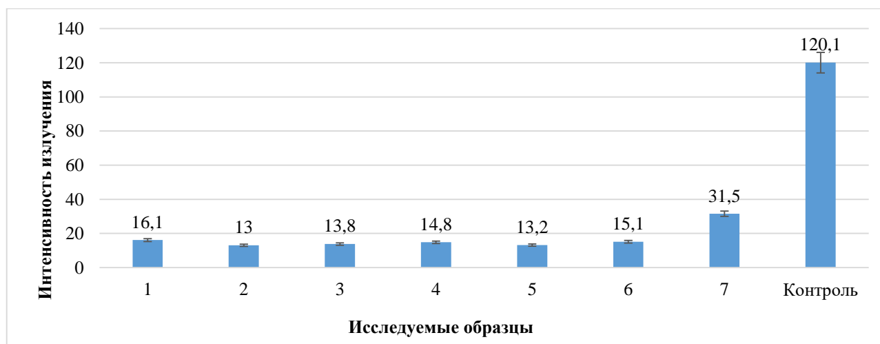
Рис. 2. Способность солнцезащитных кремов поглощать УФ-В излучение, mW/m 2