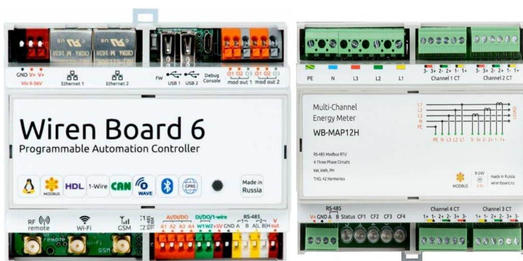
Рис. 1. Внешний вид контроллера Wiren Board 6 и модуля WB-MAP12

Одним из таких, является Wiren Board 6 и подключённый к нему через разъёмы А и В RS-485 счётчик WB-MAP12 предназначенный для мониторинга качества электропитания (рис.1). Контроллер Wiren Board 6 имеет ряд преимуществ, так как у него с запасом остаются вольтметры, которые можно использовать для замера напряжения на реле и других устройствах в релейном шкафу в сигнальной установке и температурный диапазон позволяет его устанавливать в релейном шкафу и использовать без дополнительного охлаждения летом и обогрева зимой.