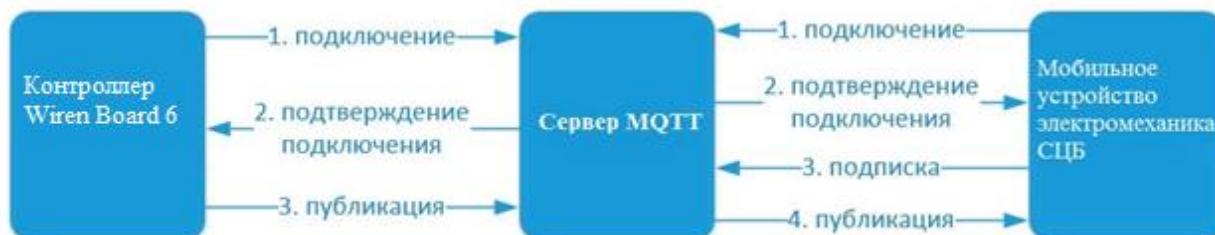
Рис. 2. Схема передачи информации

Система удаленного контроля напряжения сигнальных установок работает следующим образом: измеряемое напряжение поступает на аналоговый вход многоканального АЦП, где происходит преобразование сигнала в дискретный код. После этого код через интерфейс связи поступает на модуль передатчика и формируется пакет данных для дальнейшей передачи через GPRS на удалённый сервер. Информация с GPRS-модуля поступает на сервер, с которого информация поступает на стационарное или мобильное устройство работника СЦБ.