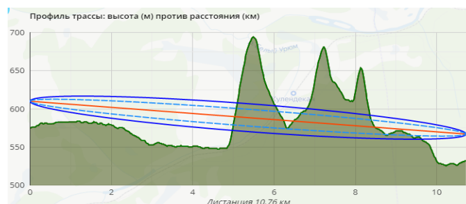
Рисунок 2 – Эллипсоид перекрытий участка Ульякан-Урюм, построенный по модели Окамура - Хата.

Для проверки полученных результатов расчеты по модели Окамура – Хата, сравнили с данными программы Linktest, с помощью которой были построены эллипсоиды перекрытий для определения качества связи на выбранном участке.