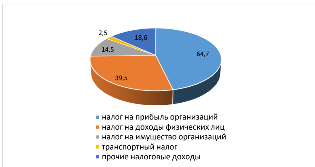
Рисунок 2 - Формирование налоговых доходов бюджета Иркутской области за 2019 год [4]

Анализ формирования налоговых доходов за 2019 г. представлен на рисунке 2.