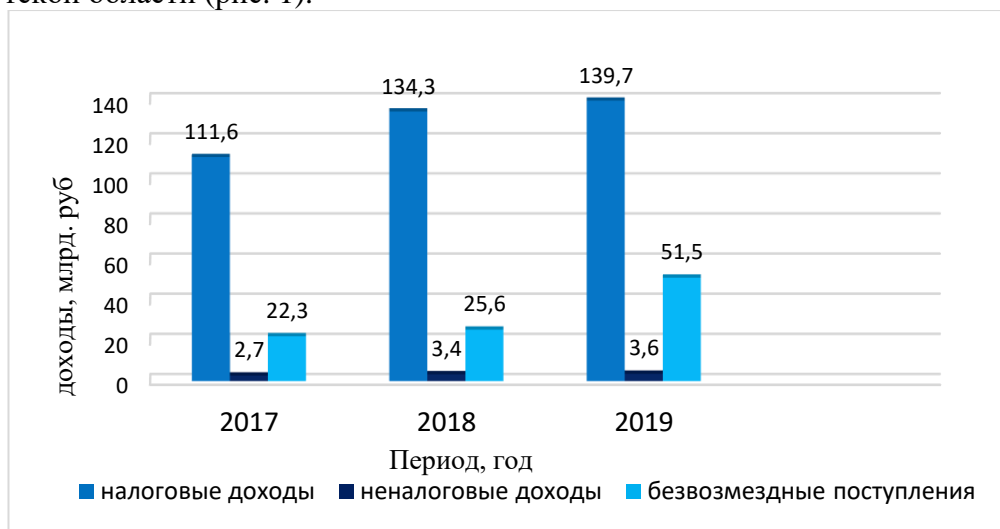
Рисунок 1 - Динамика источников формирования доходной части бюджета Иркутской области за период с 2017 по 2019 гг. [2], [3], [4]

Рассмотрим динамику источников формирования доходной части бюджета Иркутской области (рис. 1).