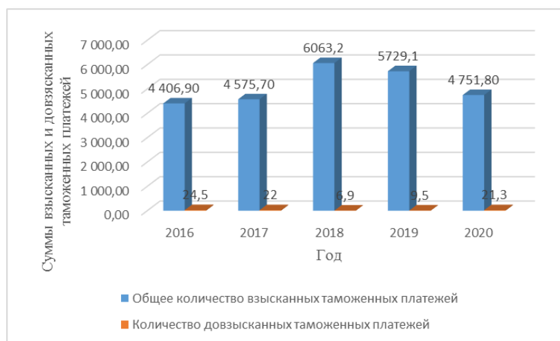
Рис. 2. Суммы взысканных и довзысканных таможенных платежей за период 2016–2020 гг.

По данным диаграммы рисунка 2 видно, что в 2016 году сумма довзысканных таможенных платежей составила 0,6% от общей суммы всех взысканных таможенных платежей, в 2017 году соответственно – 0,5%, в 2018 году – 0,1%, в 2019 году – 0,2%, в 2020 году – 0,4%. Подробный анализ о довзысканных суммах таможенных платежей представлен в соответствии с рисунком 3.