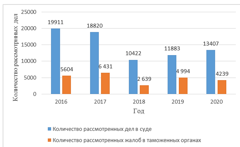
Рис. 1. Количество рассмотренных дел в судах и жалоб в таможенных органах

По данным таблицы видно, что наибольшее количество рассмотренных дел по обжалованиям решений, действий (бездействия) должностных лиц таможенных органов рассматривается в судах за весь анализируемый период. Более наглядно данная информация представлена на рисунке 1.