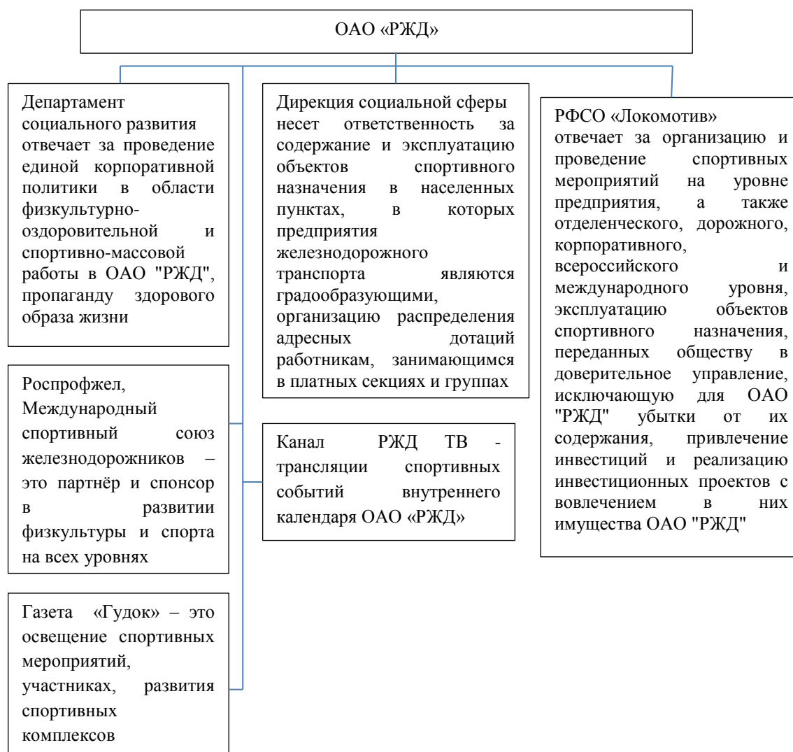
Рис. 3. Функции подразделений ОАО «РЖД», влияющих на развитие корпоративного спорта