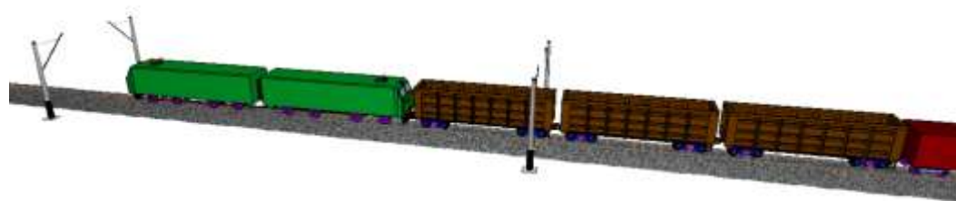
Рис. 3 Расположение 3D вагонов в составе

С целью извлечения единого числового результата рассчитывалось среднее арифметическое значение силы в кН для каждого колеса. Был использован состав, состоящий из двух локомотивов ВЛ80С и 67 полувагонов с нагрузкой на ось 23,5 т. Для сбора данных были использованы три 3D вагона расставленных друг за другом в начале состава. Благодаря такому расположению они воспринимают на себя наибольшие нагрузки при прохождении кривых участков, что позволит получить максимально допустимые значения при заданных скоростях движения [5]. Расположение 3D вагонов представлено на рисунке 3.