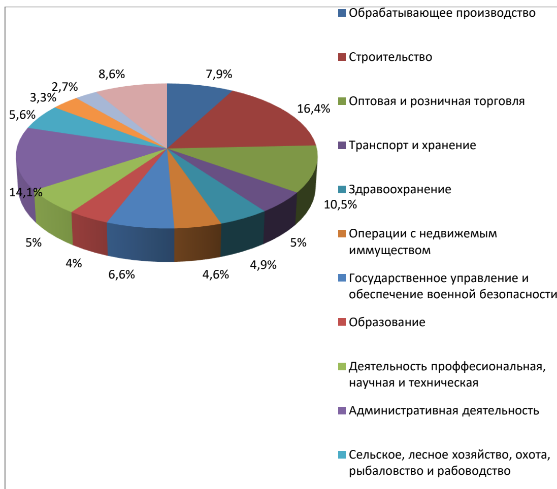
Рисунок 2 – Потребность работодателей в работниках по видам экономической деятельности в январе – ноябре 2020 года в Красноярском крае

Среди должностей служащих самое большое количество рабочих мест заявлено у менеджеров – 6751 место, при этом за содействием в трудоустройстве на данную должность обратилось 5240 человек. В данной категории большим спросом пользуются следующие профессии: специалист (3756 мест), учитель (3158 мест), врач (3152 места), военнослужащий (2826 мест), инженер (2686 мест), мастер (2474 места), агент (2235 мест) и медицинская сестра (2058 мест).