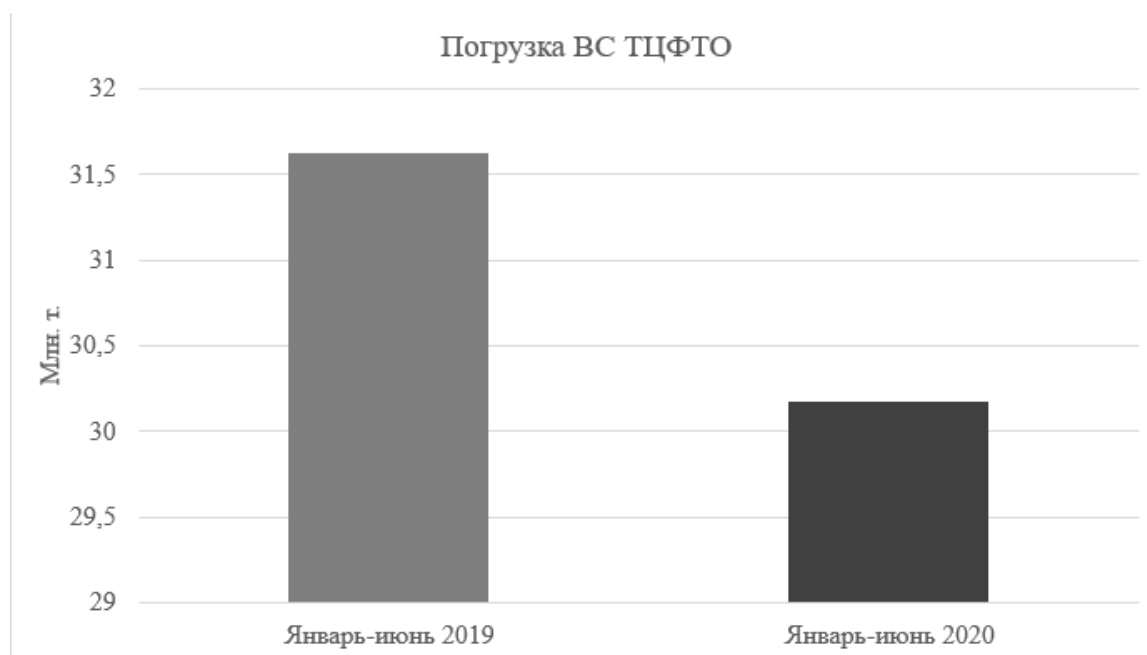
Рис. 3 –Динамика погрузки ВС ТЦФТО за 2019-2020 г.

В качестве первоочередных мер по активизации в сфере сбыта транспортных услуг предлагается повысить доступность услуг ТЦФТО, что означает возможность пользования транспортными услугами как можно более широким множеством потенциальных клиентов и потребителей: