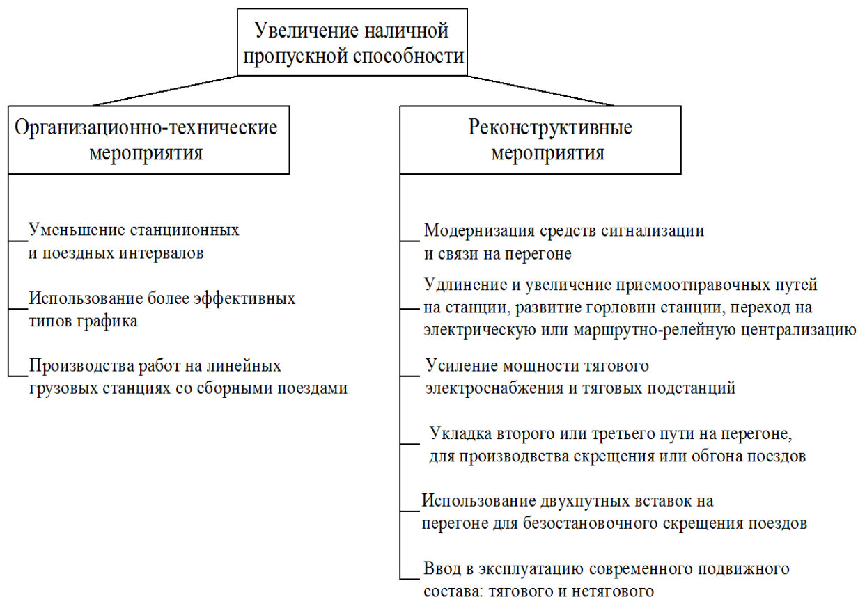
Рис. 1. Мероприятия по увеличению наличной пропускной способности

Все мероприятия по увеличению пропускной способности можно разделить на организационно-технические и реконструктивные (рис. 1). Первый способ позволяет усилить линию за счет более эффективного использования технических устройств без значительных капитальных вложений и за сравнительно короткий срок. Для исполнения второго способа требуется больше затрачиваемых ресурсов, однако их использование позволяет резко увеличить количество пропускаемых поездов за сутки [2].